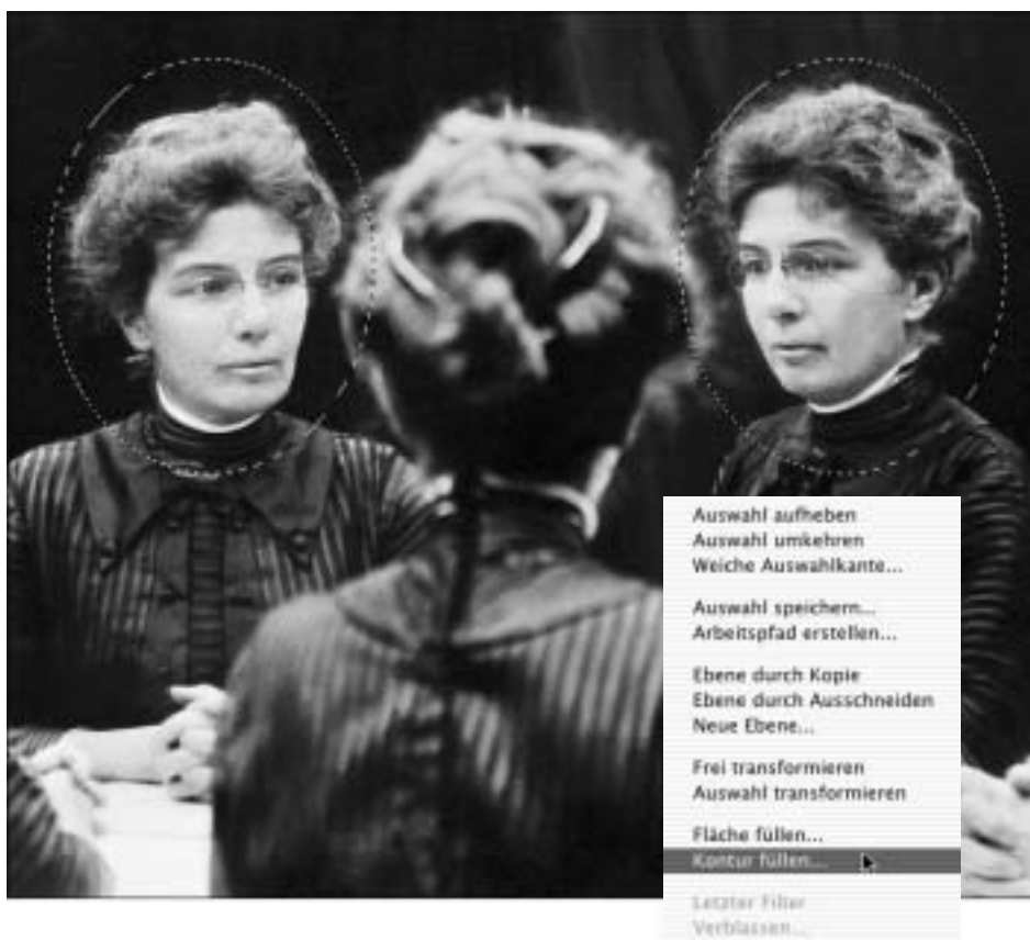
Abb. A.1: Wenn Sie nicht weiterwissen, klicken Sie mit gehaltener Ctrl-Taste, und Sie erhalten ein Menü mit hilfreichen Befehlen.

Einer der am besten versteckten Tricks in Photoshop ist das Klicken bei gehaltener Ctrl-Taste. Versuchen Sie es einmal: Drücken Sie die Ctrl-Taste und halten Sie die Maustaste im Bildfenster. Sie erhalten ein Popup-Fenster mit Befehlen, die sich auf Ihre gegenwärtige Aktion beziehen. Falls Sie zum Beispiel mit dem Lasso Ctrl-klicken, während die Auswahl aktiv ist, erhalten Sie die Liste der Befehle, die Sie in Abbildung 1 sehen. Obwohl Sie auf eine Auswahl auch andere Befehle anwenden können, sind dies doch die gebräuchlichsten.