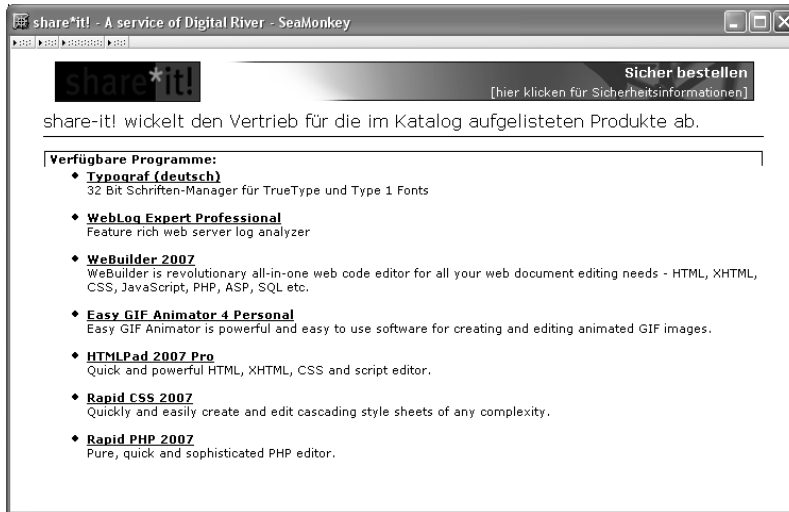
Abbildung 4.14 Die neu erstellte Katalogseite

viele nicht ausreichende Englisch-Kenntnisse haben, um technische Texte zu verstehen.