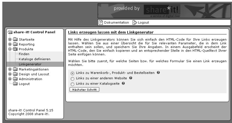
Abbildung 4.8 Welcher Link ist gewünscht?

Als Erstes können Sie einen Link zu einer Seite erstellen, wo nicht nur das jeweilige Produkt aufgelistet und kurz beschrieben wird, sondern Sie haben die Möglichkeit, automatisch einen Verweis zu der Bestellseite und dem Warenkorb zu integrieren.