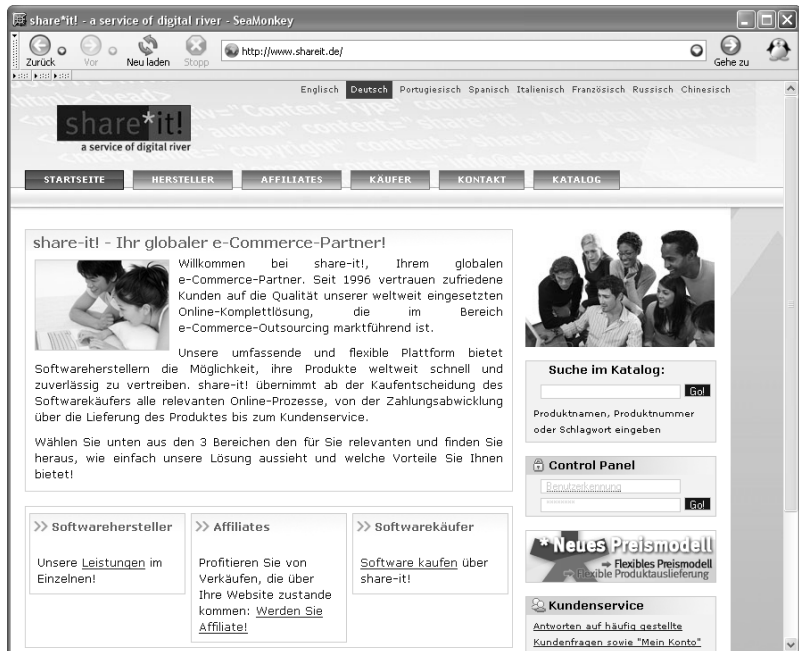
Abbildung 4.1 www.shareit.de

Das Zielpublikum sind dabei kleinere Firmen und einzelne Programmierer, die sich um das Administrative nicht kümmern können oder nicht kümmern möchten. Dank share-it! kann man sich auf seine Kernkompetenzen konzentrieren. Allerdings interessiert uns dieser Bereich nur am Rande. Die Plattform share-it! bietet zudem ein Affiliate- bzw. Partner-Programm an, das nach einem ähnlichen Prinzip funktioniert wie bei dem Amazon-Partnerprogramm, das Sie in Kapitel 3 kennen gelernt haben. Auch hier entscheiden Sie sich für ein Produkt, das Sie bewerben wollen, binden den generierten Link auf Ihrer Website ein, und sobald jemand über diesen Link das Produkt kauft, bekommen Sie eine Provision. Davon profitieren alle: Der