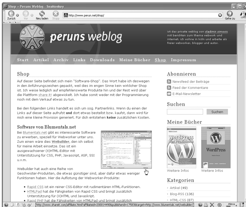
Abbildung 4.12 Beispiel von www.perun.net/shop/

Hierbei haben Sie zwei Möglichkeiten. Zum einen können Sie die Adresse einer beliebigen Unterseite von der Präsenz des Anbieters angeben, um einen Partnerlink zu generieren, oder Sie können automatisch einen Partnerlink erstellen, der auf die Startseite des jeweiligen Unternehmens führt. Nach diesem Prinzip – Partnerlinks auf die Startseite und auf die einzelnen Produktunterseiten – habe ich den »Software-Shop« 5 in meinem Weblog umgesetzt.