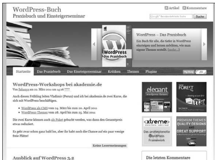
Abb. L1.5: Artikelüberschrift als Permalink

Da in Weblogs der einzelne Artikel im Fokus steht, ist es nur logisch und konsequent, dass der einzelne Artikel über einen langlebigen und eindeutigen Link erreichbar ist. Solche Links nennt man Permalinks. Das Wort Permalink ist die Abkürzung von permanenter Link. Somit ist es möglich, auf den entsprechenden Artikel zu verlinken und diesen in seine Bookmarks (Lesezeichen, Favoriten) aufzunehmen; zwei sehr wichtige Vorteile.