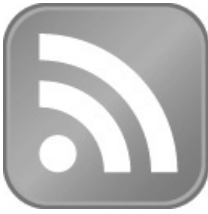
Abb. L1.8: Feed-Icon

Wenn Sie das Symbol aus der obigen Abbildung auf einer Website sehen, können Sie davon ausgehen, dass diese Website auch einen Newsfeed anbietet.