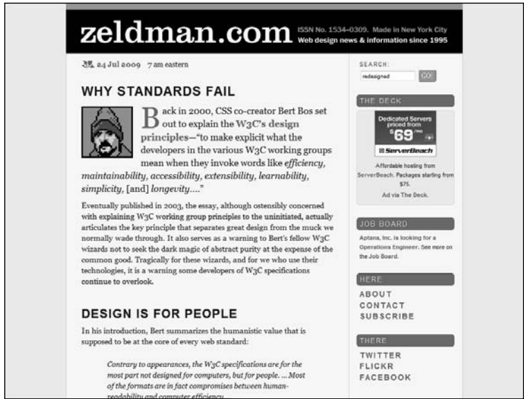
Abb. L1.2: Das Weblog von Jeffrey Zeldman, einem sehr bekannten Webdesigner ( www.zeldman.com ) aus den USA

und Blogs, die über Webdesign, Programmierung, Bildbearbeitung etc. berichten. Analog gilt das auch für Themenbereiche, die ähnliche Voraussetzungen haben.