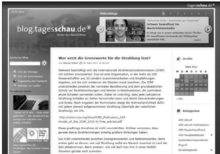
Abb. L1.4: Weblog der Tagesschau

Zunehmend setzen auch Verlage und Medienhäuser Weblogs ein. »Die Zeit« und das »Handelsblatt« haben mehrere Weblogs. Auch die Tagesschau ( www.blog.tagesschau.de ) hat ein Weblog. Weblogs sind in der Informationsbranche ein wichtiges Werkzeug, da man mit ihnen sehr schnell auf aktuelle Ereignisse und vor allem auf »Nischenthemen« adäquat reagieren kann.