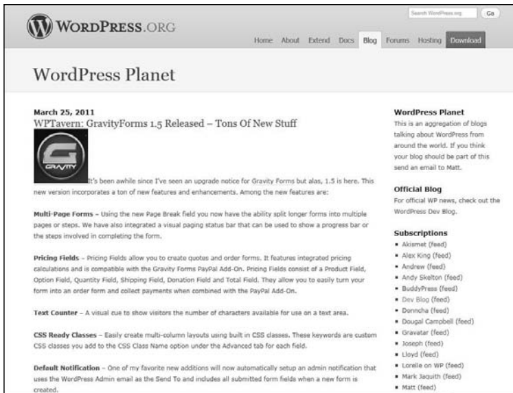
Abb. L1.7: WordPress-Planet