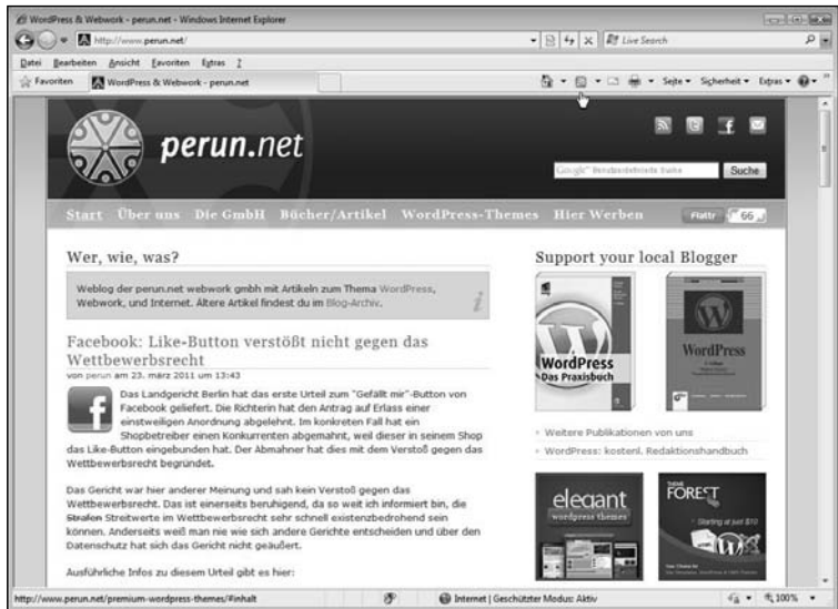
Abb. L1.10: Feed-Icon in der Menüleiste von Internet Explorer

Je nach Browser erscheint das Feed-Icon leider an unterschiedlichen Stellen. In Mozilla-Firefox und Opera z.B. erscheint es in der Adressleiste, in Internet Explorer erscheint es in der Menüleiste. Wo kämen wir denn hin, wenn sich die Browserhersteller wirklich dazu durchringen würden, eine Sache bis zum Schluss einheitlich zu gestalten?