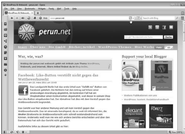
Abb. L1.9: Feed-Icon in der Adressleiste von Opera

Wenn Sie als Browser Mozilla Firefox, Internet Explorer 7 und höher, Opera, Safari oder Konqueror einsetzen, haben Sie das oben beschriebene Problem gar nicht. Diese Browser zeigen in der Adressleiste bzw. in der Menüleiste automatisch an, ob eine Website Newsfeeds anbietet: