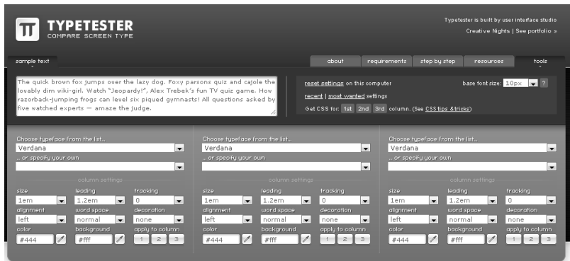
Abb. 1.5: http://www.typetester.org/

Ich empfehle, das »Look and Feel« der Seite durch das Design und die Bilder zu erzeugen und bei der Schrift im Fließtext auf die Webstandards zurückzugreifen. Aber machen Sie sich selbst ein Bild davon, ob Sie zu Gunsten der Wirkung auf die leichte Lesbarkeit verzichten wollen: